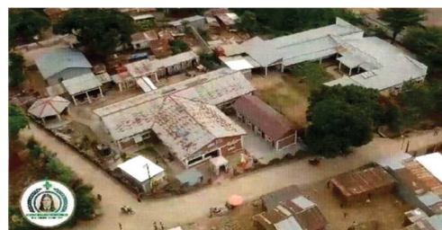
Dispensario Kalundu (Congo)